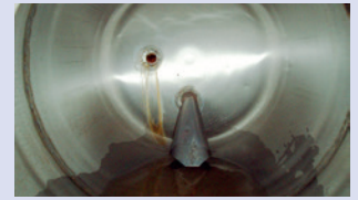
Nach der chemischen Entkalkung